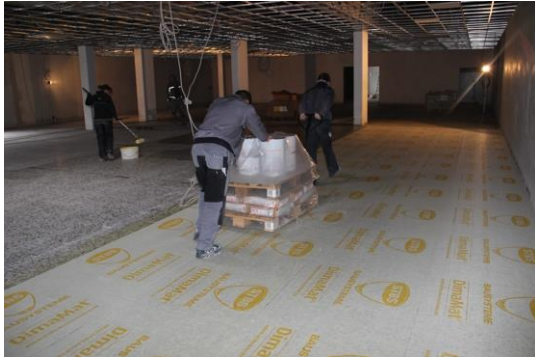
DimaMat® SPZ 1 auf Verkehrswegen – sofort befahrbar!

Neben der Überbrückung der zahlreichen großen Risse, rückte besonders ein Vorteil dem Objekt in den Fokus: Die Matte ist sofort nach der Verlegung begeh- und befahrbar, sodass sie auch auf den Verkehrswegen verlegt – und die Fläche direkt danach mit dem beladenen Hubwagen befahren wurde!