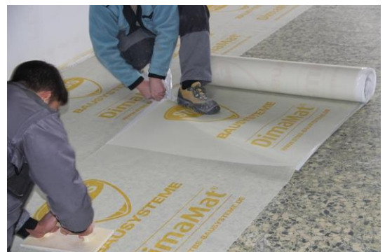
Abrollen, mit dem Fuß fixieren, abziehen und andrücken – so geht's am Besten!

Es ist empfehlenswert, die Matte mit einem Reibebrett anzudrücken, die endgültige Fixierung erfolgt beim Aufbringen des Fliesenbelags.