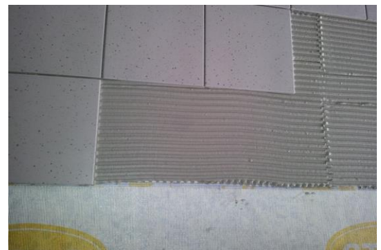
Fliesen verlegen auf perfektem haftendem Untergrund

Selbst Anwender, wissen wir, dass neue Produkte aus Baustellen erst mal kritisch betrachtet werden. Doch nicht nur die Entkopplungswerte mit revolutionärer Rissüberbrückung sprachen hier für den Einsatz der DimaMat® SPZ 1, auch im Praxistest konnte sie überzeugen, sowohl in der Verlegung als auch bei der anschließenden Verfliesung.